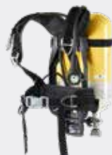
SCBA - selvstendig åndedrettsapparat